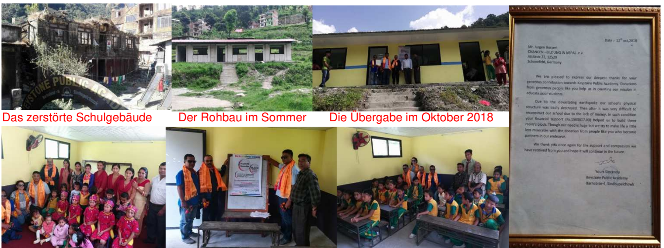
Das zerstörte Schulgebäude

Ein besonderer Dank geht an Rupesh Machamasi und sein Team, die den Bau geplant und begleitet haben und so wesentlichen Anteil daran haben, dass der Bau in so kurzer Zeit fertiggestellt werden konnte. Nun hoffen wir auf einen großen Erfolg des Benefizkonzerts am 14.11. (siehe Punkt 6), damit bald weitere 4 Klassenräume erstellt werden können.